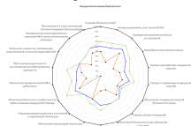
Диаграмма с результатами самоаудита по эпидбезопасности за 3 месяца

Цветом выделены рекомендации, которые клиника не выполнила